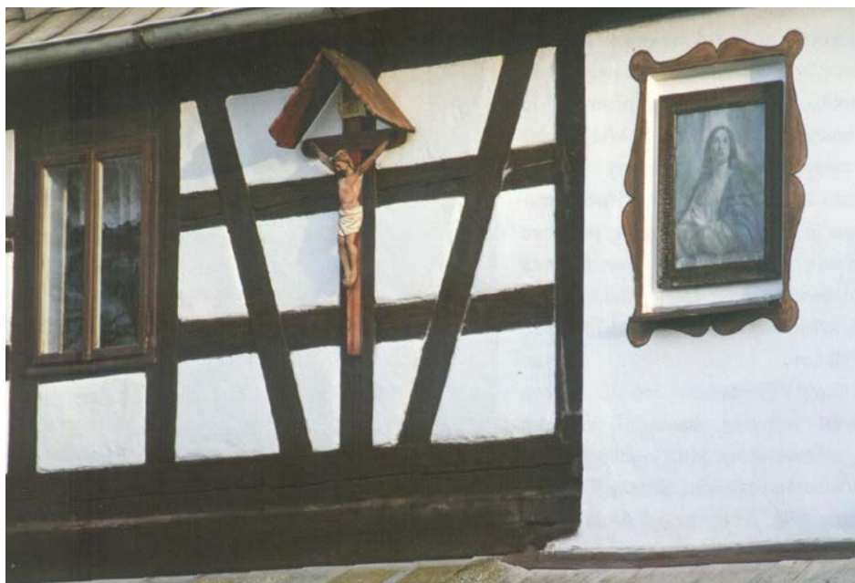
V roubence u hlavní silnice přepřahali koně a vozkové odpočívali.

pozemků původní zástavby. Ještě roku 1800 tvořilo obec jen několik hrázdných domů v typické lidové architektuře. Z nich se zachovala roubenka čp. 1 na východním okraji obce. Hory byly dlouho ryze zemědělskou obcí. Ještě v roce 1939 zde žilo 80 rolníků, z nichž většina vlastnila menší výměru než 20 hektarů polí. Starostí bylo vždy zajistit dostatek vody. Obcí neprotéká žádný potok a dešťovou vodu odvádí Loučský a Chodovský potok do Ohře. Pitnou vodu čerpali z řady studní. Ještě v 19. století jich bylo v obci pět. Jejich kapacita nestačila a místní chodili pro vodu do vzdálených lučních studánek. Problém nevyřešila stavba vodojemu na Rohu po roce 1903, ale teprve až vodovod roku 1990. V katastru Hor je dodnes devět a půl hektaru vodní plochy tzv. Nebeských rybníků.