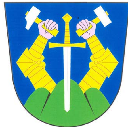
Znak obce Hory

ským hradním pánům. Ves se zřejmě rozkládala kolem podlouhlé návsi (někde v dnešní severovýchodní části obce). Svědčí o tom rozdělení