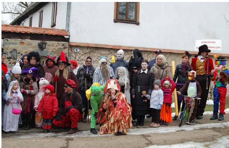
K zachovaným tradicím patří masopust