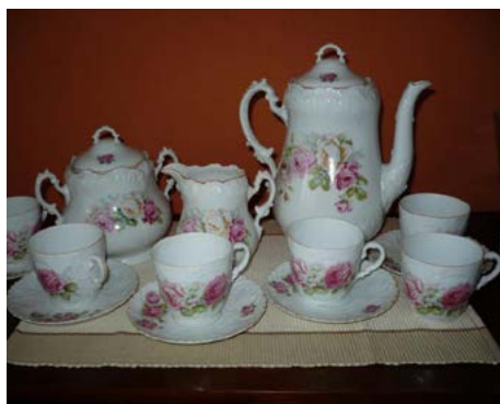
Reliéfní tvar Princess Louise z porcelánky Hory