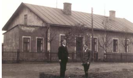
Roku 1893 dostala obec vlastní dvoutřídní školu

soukromého majitele podle zápisu v pozemkové knize město Karlovy Vary.