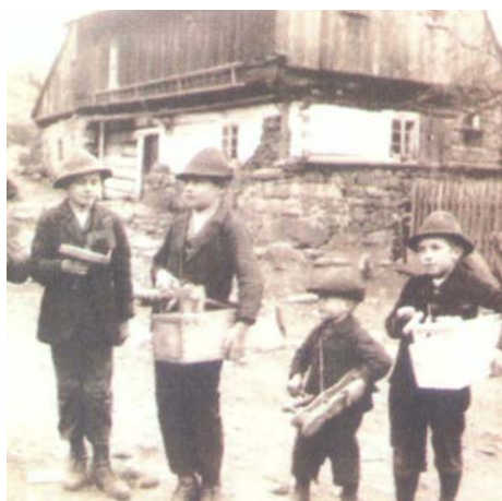
Obec si na tradicích zakládala