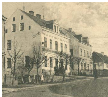
Obec koncem 19. století

Území tvořila řada osad a samot. Severozápadně od obce ležela již v roce 1875 největší osada Podhoří (Hunschgrün), v níž roku 1910 žilo 471 obyvatel. Dále k Horám patřily samoty Ovčárna (Schäferrei), Chudý Dvůr (Schmalnhof), Jalový Dvůr (Kaltenhof), Vildenava (Wildenauerhof) a