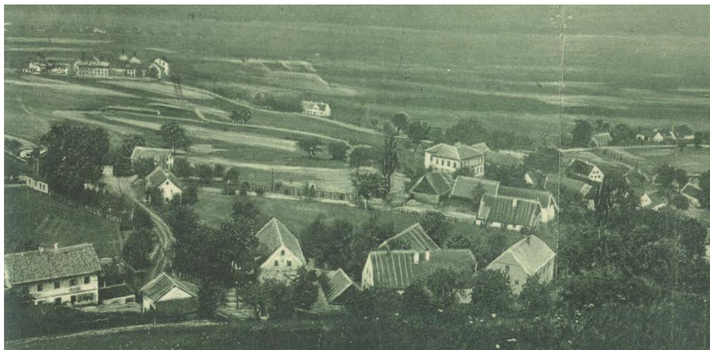
Celkový pohled na Hory