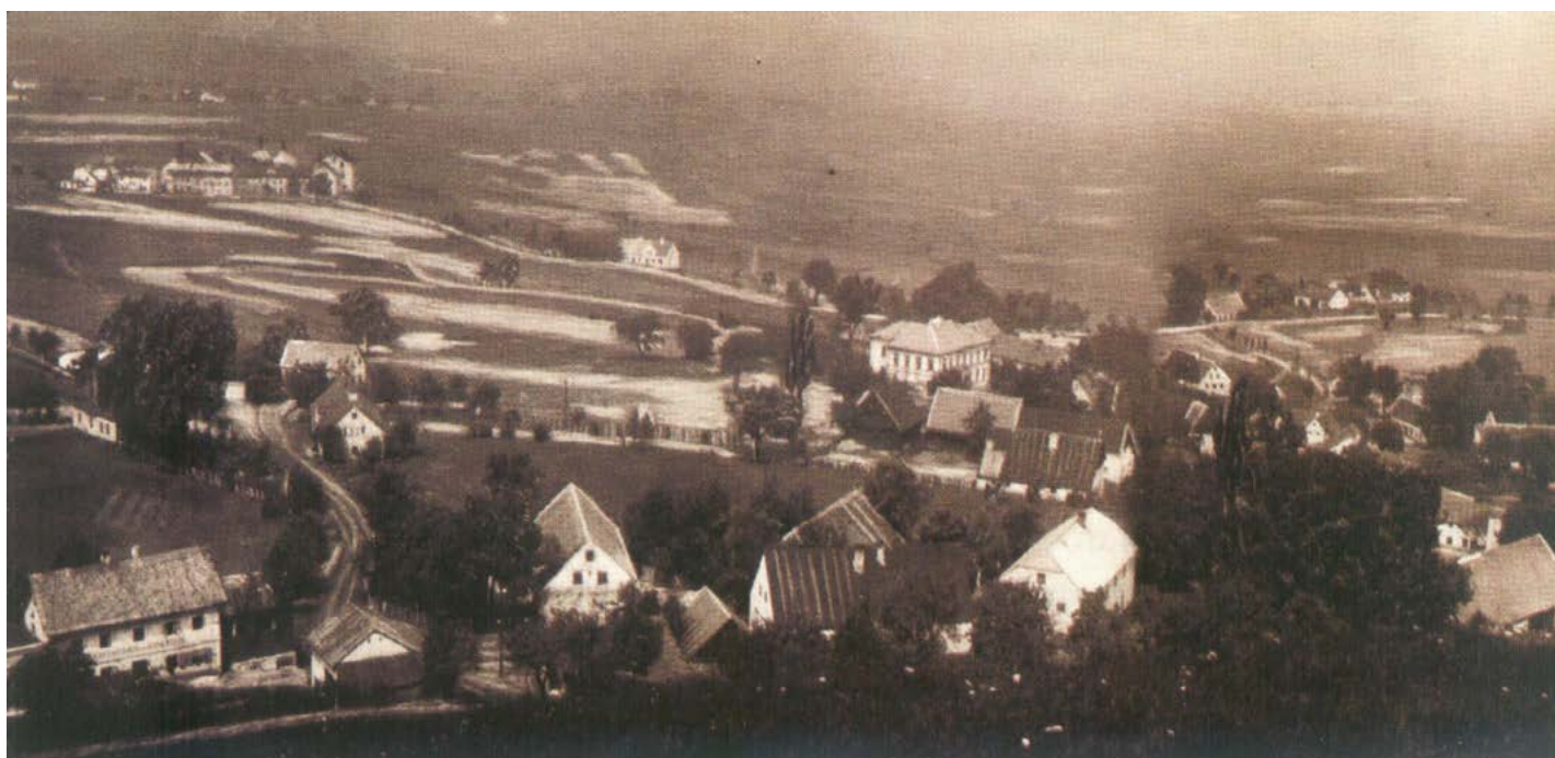
Panorama obce Hory před válkou

Přestože většinu obyvatel obce tvořili Němci, jejich soužití s českou menšinou bylo až do roku 1938 klidné a bezproblémové. Potvrzuje to německy psaná kronika z doby 1. republiky, která líčí prezidenta ČSR T.G. Masaryka jako "ctěného a uznávaného". V roce 1930 měly Hory včetně osad 1028 obyvatel, z toho bylo 992 Němců a jen 18 Čechů. Všichni vítali společně 2. června 1937 prezidenta Eduarda Beneše, který obci