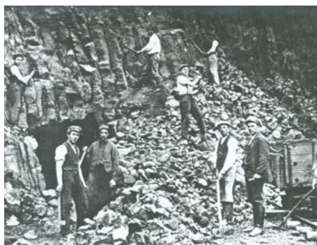
Ze zemědělců se stali horníci