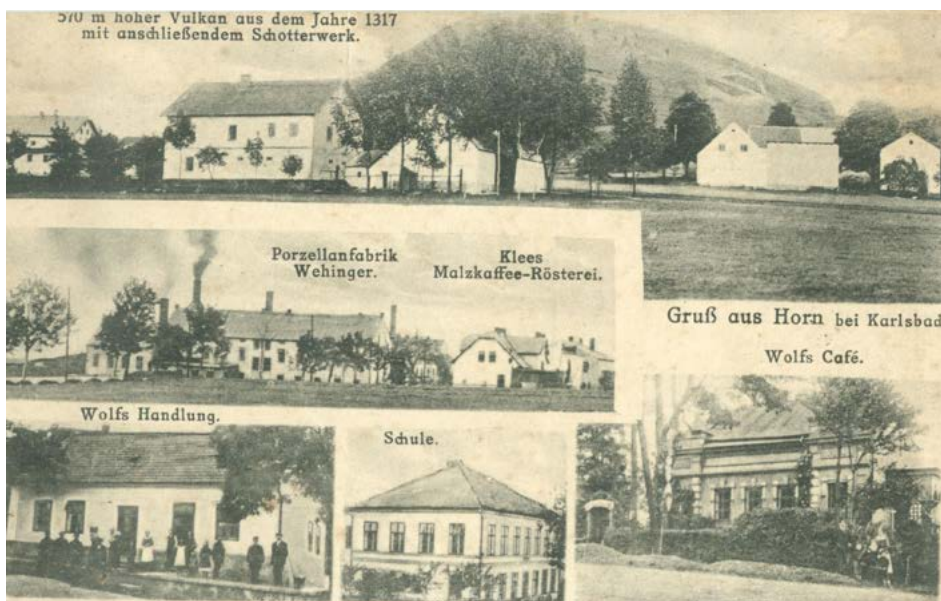
Obec Hory měla vlastní pohlednice

Po odsunu Němců došlo k dosídlení Hor. Jako první přijelo 14 rodin z vnitrozemí. Nejpočetnější skupina 30 nových obyvatel přišla z Nové Bukové a Polesí na Pelhřimovsku. Další dosídlenci byli z Berounska, Kladenska, Kolínska, Prachaticka a jižních Čech. Celkem dorazilo v letech 1945 až 1956 do obce 422 dosídlenců. Kvůli vzdálenosti od hranice umístila armáda v roce 1954 do